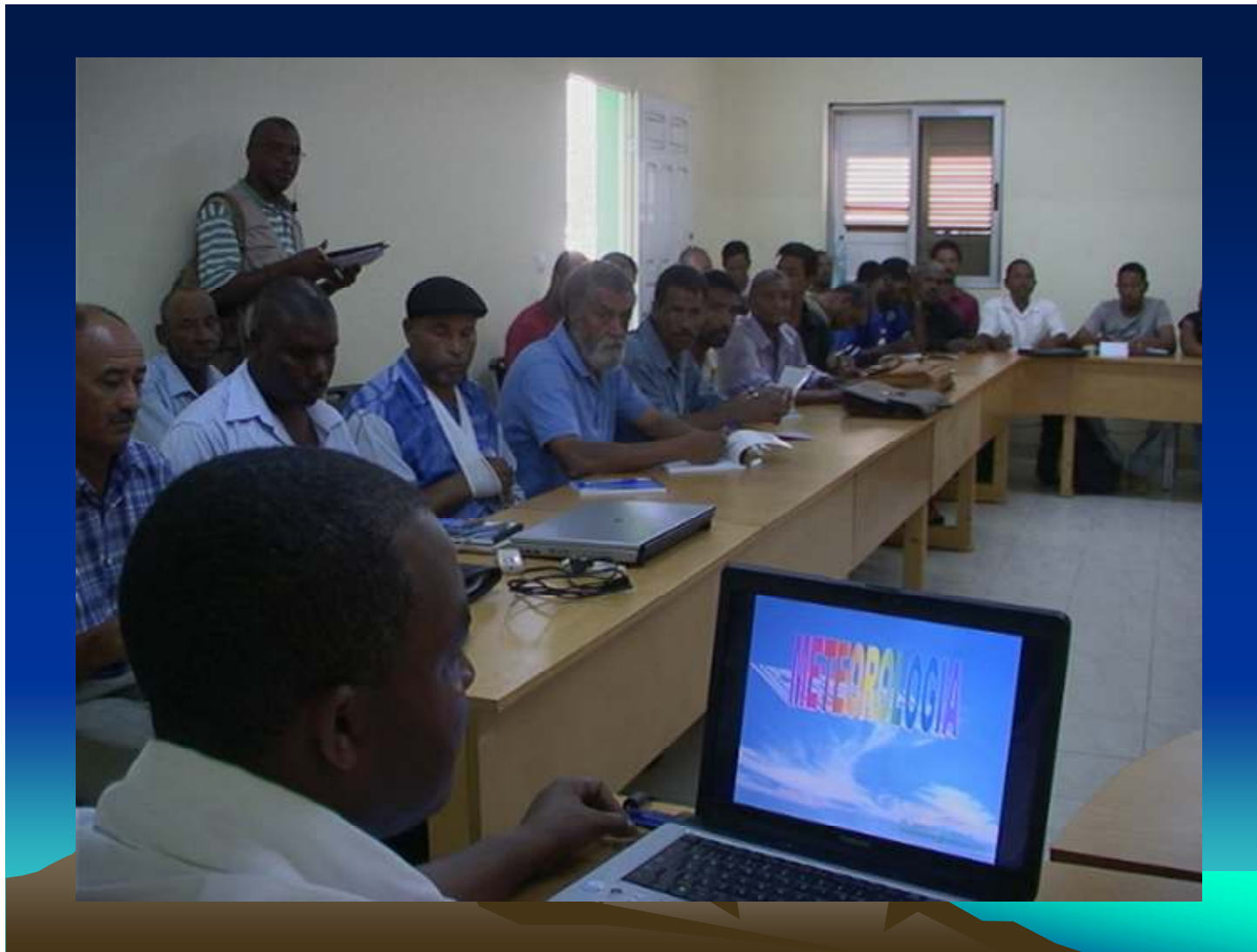
Figure 1 : Cidade de São Filipe, 01/07/2009