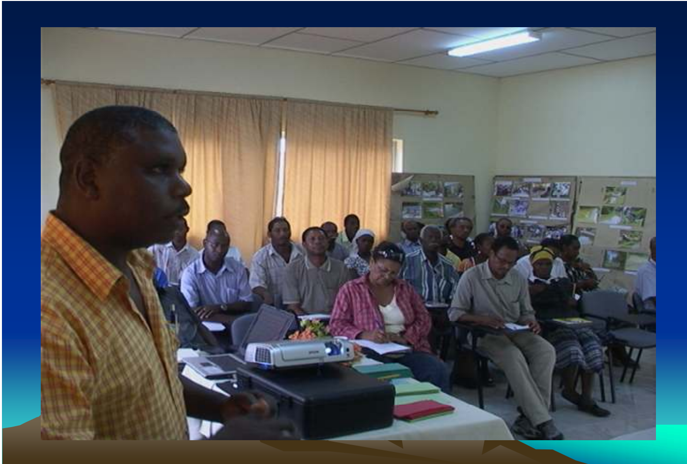
Figura 24: Cidade de Assomada, 05/07/2009