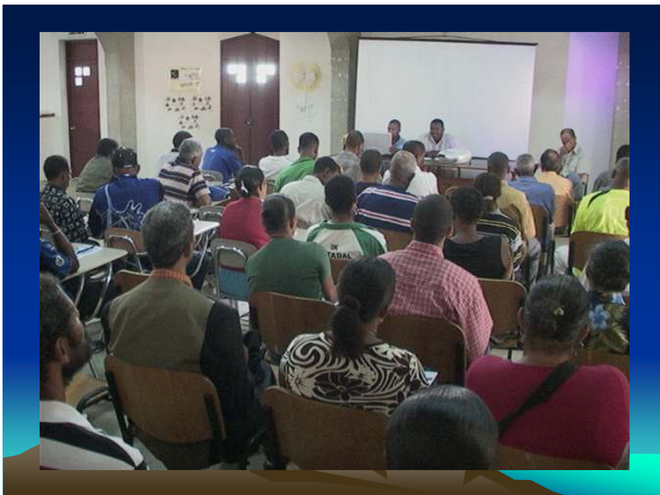
Figura 10: Brava, Vila de Nova Sintra, 07/07/2009