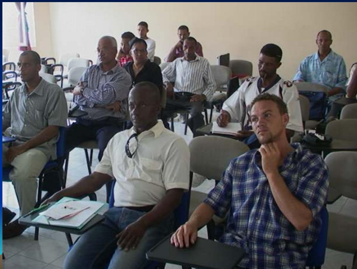
Figura 6: Vila dos Mosteiros, 03/07/2009