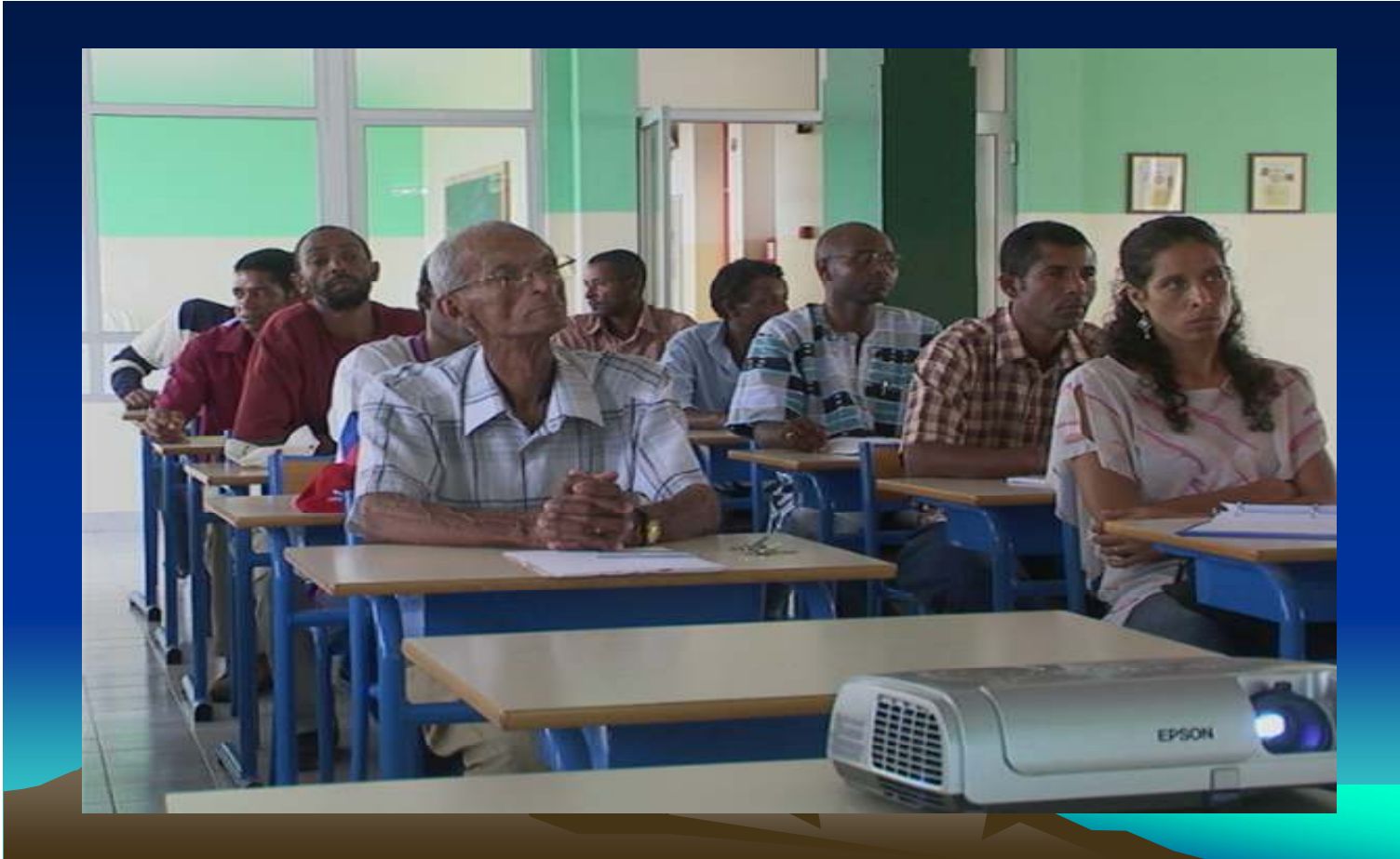
Figura 15: Cidade de Porto Novo, 14/07/2009