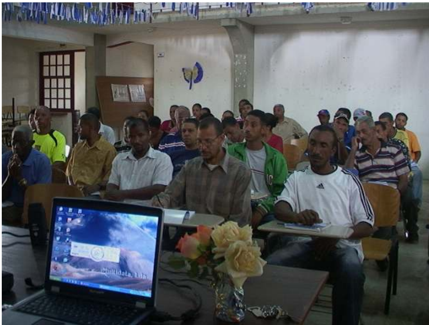
Figura 9: Brava, Vila de Nova Sintra, 07/07/2009