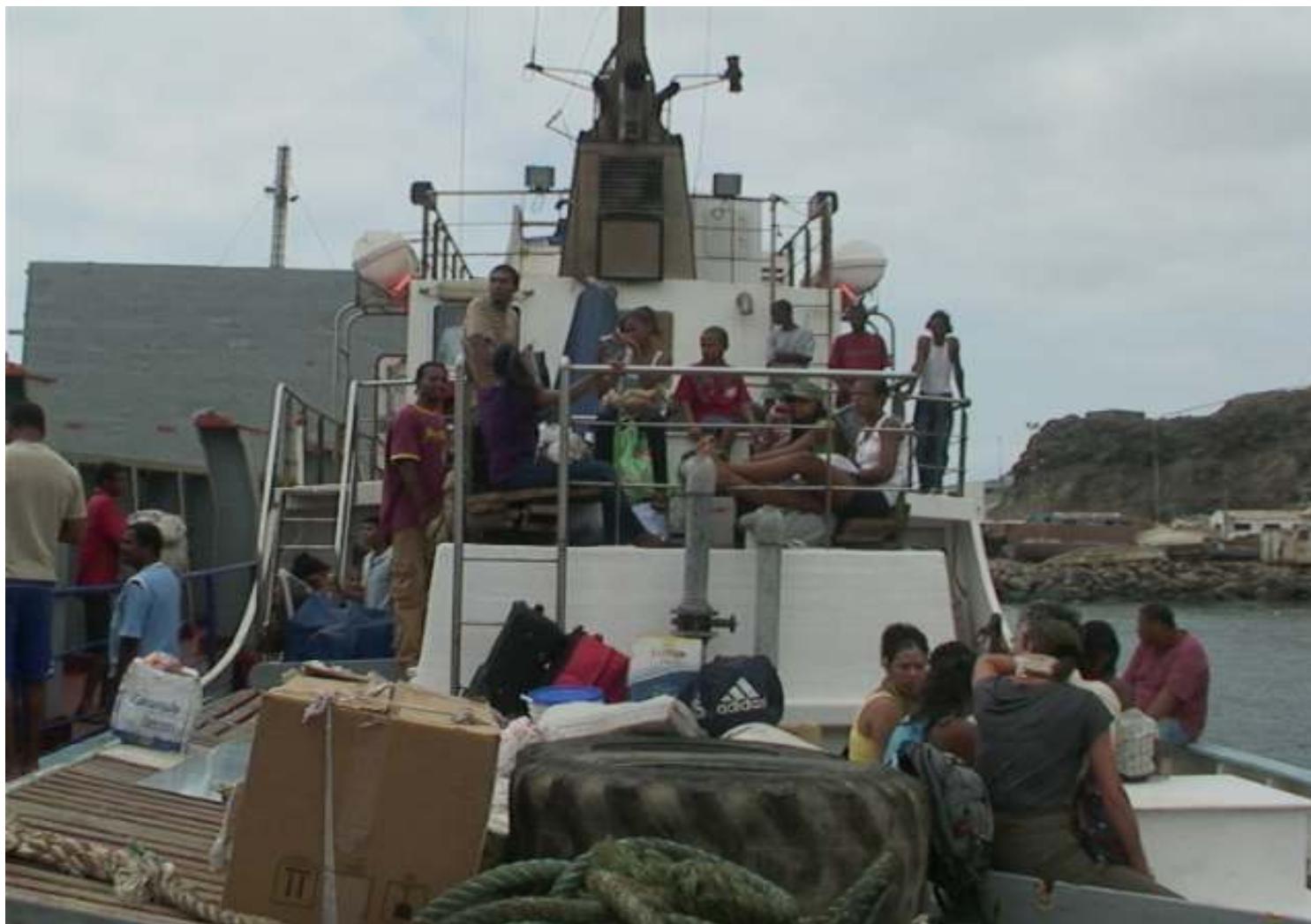
Figurae7: Deplacement á Brava, 05/07/2009